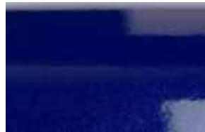
STEEL BLUE METALLIC