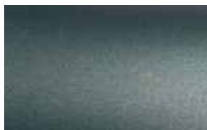
PINE GREEN METALLIC