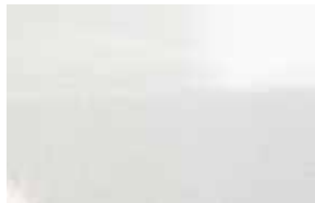
WHITE GOLD SPARKLE